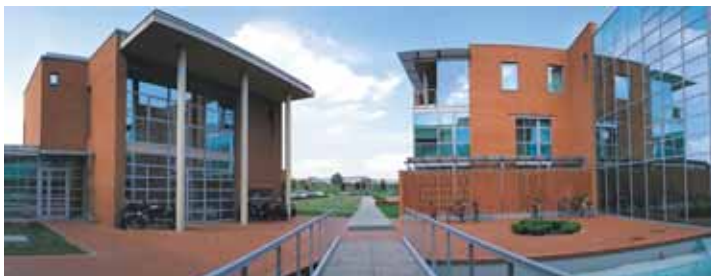
Graphisoft Park, Budapest

In der Stadtplanung, bei öffentlichen Gebäuden, Verkehrsprojekten, in der Forschung, bei Wohn- und Industriebauten: Software aus dem Hause Graphisoft kam bei zahlreichen namhaften Projekten zum Einsatz. Hierzu zählen das digitale Stadtbild von Berlin – ein 3D-Modell der Hauptstadt – das Bürohochhaus Potsdamer Platz 1 in Berlin, das Fraunhofer Institut in Erlangen sowie die in Leipzig geplante U-Bahn-Station Markt.