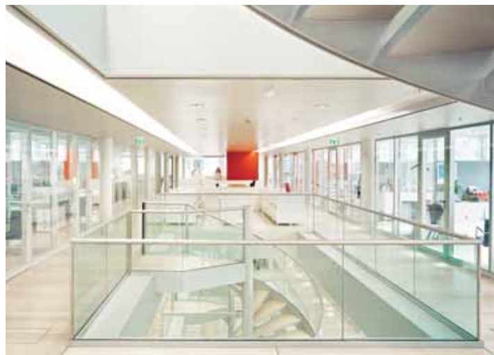
Konzernzentrale des Energieversorgers E.ON, München

Auch in den Bauunternehmen hat sich die Stimmung erkennbar verbessert, was sich in einem Zuwachs an Neukunden bei der Nemetschek Bausoftware GmbH ausdrückt. Das Unternehmen hat im ersten Quartal seine Marketing- und Vertriebsaktivitäten mit der österreichischen AUER – die Bausoftware GmbH gebündelt und vermarktet seine kaufmännische Bausoftware nun in Österreich unter dem Namen AUER financials.